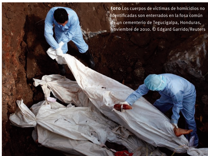
Foto Los cuerpos de víctimas de homicidios no identificadas son enterrados en la fosa común de un cementerio de Tegucigalpa, Honduras, Noviembre de 2010. © Edgard Garrido/Reuters

Este capítulo analiza minuciosamente la situación en los 58 estados que registran tasas de muertes violentas (muertes directas resultantes de conflictos y homicidios intencionales combinados) de más de 10 por 100.000 habitantes, para concluir que 25% de los países del mundo (es decir, aproximadamente 1,2 mil millones de personas o 18% de la población mundial) registran tasas de violencia armada altas y muy altas, y abarcan aproximadamente dos tercios (63%) de todas las muertes violentas. Se estima que 285.000 personas son asesinadas en forma violenta cada año en estos países. Asimismo, 14 de estos países están registrando tasas de muertes violentas considerablemente altas (más de 30 muertes violentas por 100.000 habitantes). Estos países albergan un 4,6% de la población mundial y registran aproximadamente 124.000 muertes violentas. En otras palabras, más de una de cada cuatro muertes violentas en el mundo ocurre