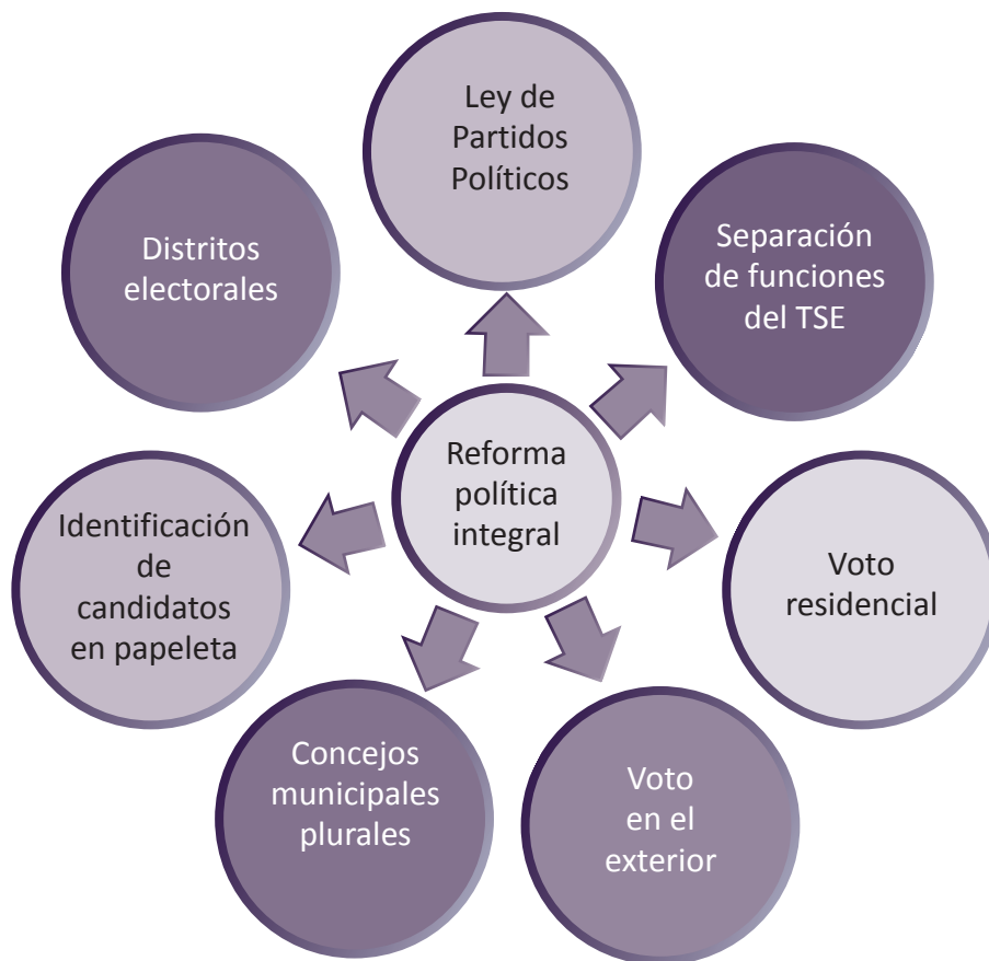
Gráfico 3. Propuestas de Fusades sobre la reforma política integral